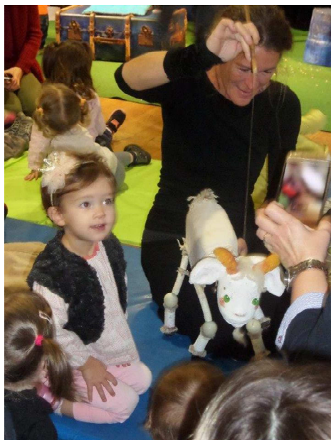
Spectacle de Noël qui a eu lieu à St Michel « les aventures de la petite chèvre Grelette »