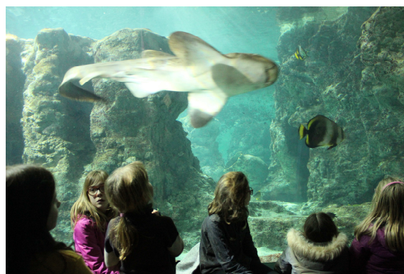
Visite à Océanopolis.