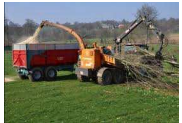
Le broyage: une des étapes de la production du bois plaquette

C'est un cercle vertueux qui bénéficie à toute la chaîne des acteurs impliqués dans la filière : fournisseurs de bois, entreprises de transformation et de transport, clients qui font des économies sur le long terme.