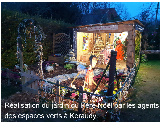
Réalisation du jardin du Père-Noël par les agents des espaces verts à Keraudy.