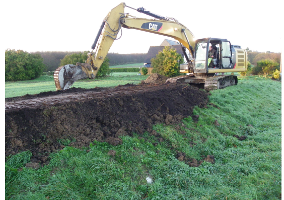
La reconquête de notre bocage continue.

En effet, cette année nous avons construit chez des agriculteurs ou des particuliers plusieurs centaines de mètres de talus ou de haies (1600 ml de plantations effectués en 2018 sur la commune de Ploumilliau).