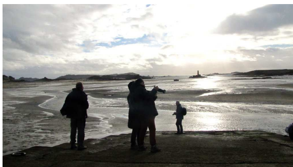
La sortie à l'Île Grande