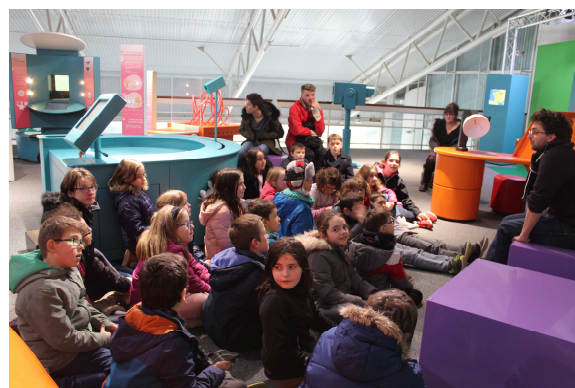
Les enfants à la cité des télécoms à Pleumeur-