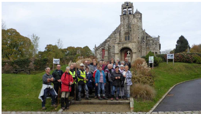
La randonnée pédestre est un excellent moyen de découvrir le patrimoine comme en témoigne la photo ci-jointe prise au pied de l'église de Loc-Envel.